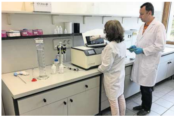
Blick ins Labor der 4D Lifetec AG in Cham.